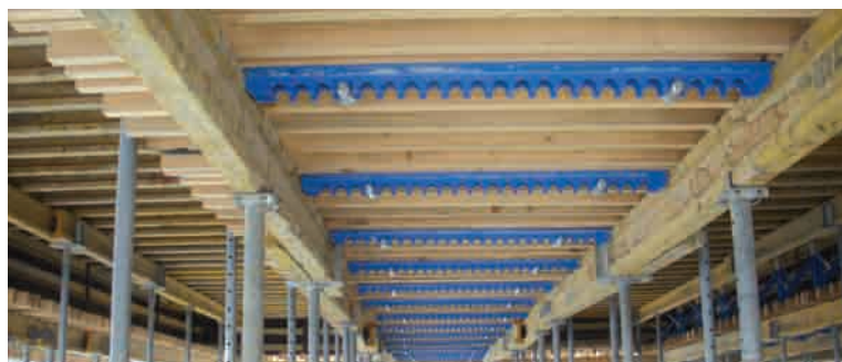
SLAB STOP END